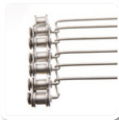
Stabgeflechtband mit Führungskette, Füllgeflechtteilung 12,80 mm