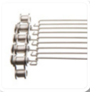
Stabgeflechtband mit Führungskette Füllgeflechtteilung 6,40 mm