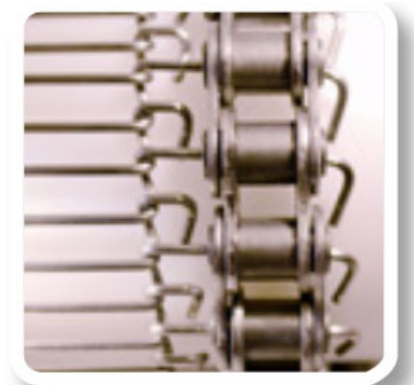
Stabgeflechtband mit Führungskette, hier mit gebogener Öse